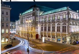
Cisársky palác Hofburg