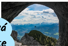
Najväčšia ľadová jaskyňa na svete

"Katka, ale ty si už bola v Rakúsku viackrát, že?" povedala Katke mama. "Áno, toto bolo už piaty krát." Katka sa rozhodla potrápiť Zuzku s Peťom a k miestam, ktoré už navštívila v Rakúsku im dala iba indície.